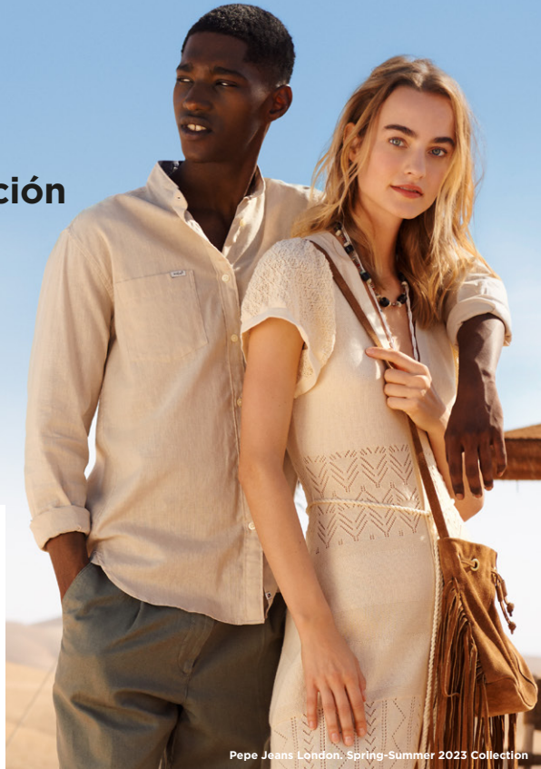
Pepe Jeans London, Spring-Summer 2023 Collection

AWWG integra las marcas emblemáticas de Pepe Jeans London, Hackett y Façonnable y es distribuidor en España y Portugal de Calvin Klein y Tommy Hilfiger . Como grupo de moda internacional, AWWG cuenta con más de 4.500 empleados y una red de distribución de más de 500 tiendas en todo el mundo . La sostenibilidad es una prioridad estratégica para el grupo, convirtiéndose en parte integral de su funcionamiento empresarial y de sus actividades de gestión de la cadena de suministro.