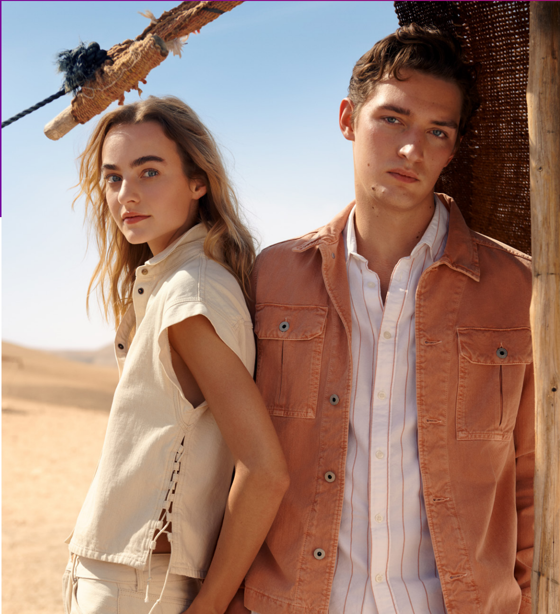
Pepe Jeans London, collection printemps-été 2023