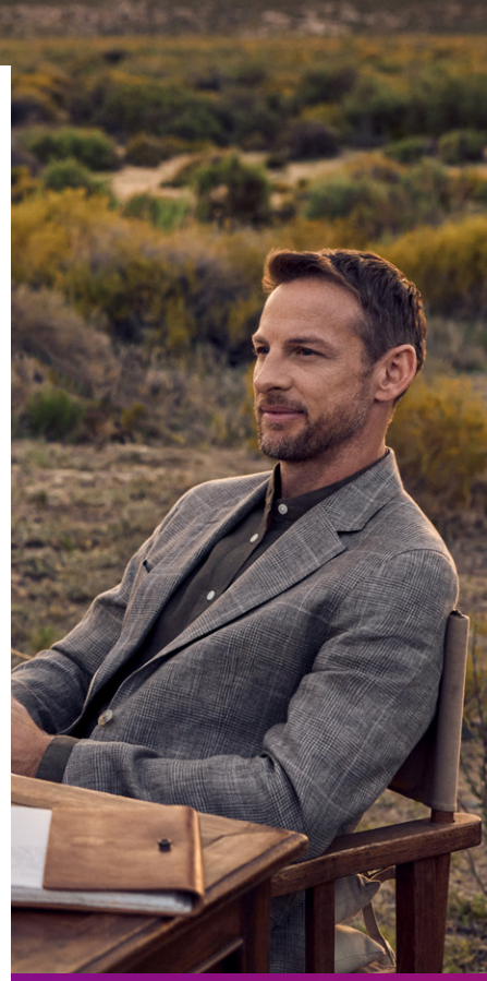
Pepe Jeans London, collection printemps-été 2023

Kubix Link PLM est également hébergée dans le cloud et connectée au système ERP existant, ce qui permet aux utilisateurs d'accéder à des données produits actualisées partout dans le monde. Les différents sites et services d'AWWG peuvent désormais collaborer en toute simplicité, prendre des décisions éclairées et limiter les erreurs à chaque étape du cycle de vie produit : de la création au marketing, en passant par la définition des spécifications techniques et l'estimation des coûts.