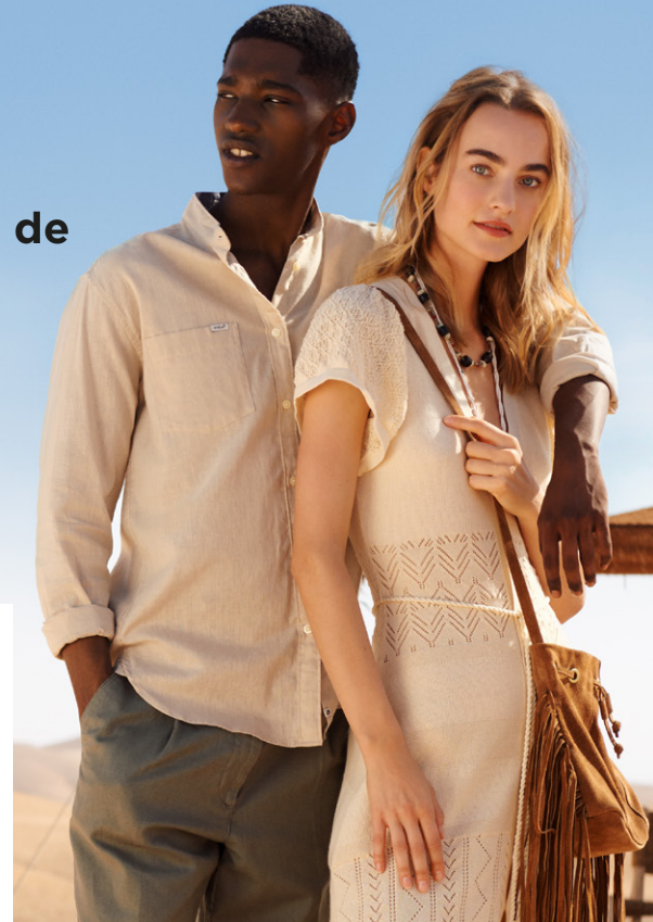
Pepe Jeans London, collection printemps-été 2023

AWWG réunit les marques Pepe Jeans London , Hackett et Façonnable , et distribue également les produits Calvin Klein et Tommy Hilfiger en Espagne et au Portugal. Le groupe emploie plus de 4 500 personnes et compte plus de 500 boutiques à travers le monde. La durabilité, qui est devenue l'une de ses priorités stratégiques, occupe aujourd'hui une place essentielle dans ses activités et dans la gestion de sa chaîne d'approvisionnement.